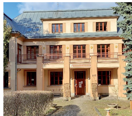
BD Hajnice – soc. rehabilitace, Oranžová kavárna, Trutnov